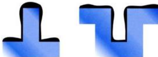
Deposición de Níquel electrolítico